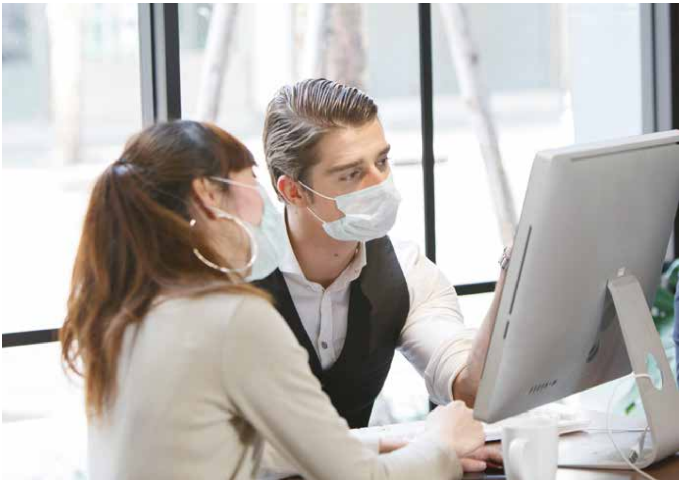
Telearbeit reduziert die Notwendigkeit sich im Büro der Ansteckungsgefahr auszusetzen.

Der österreichische Provider Telecom5 will mit dieser Gratis-Aktion angesichts der Ausbreitung des Coronavirus COVID-19 in Österreich dazu beitragen, dass Unternehmen weiter erreichbar und arbeitsfähig bleiben.